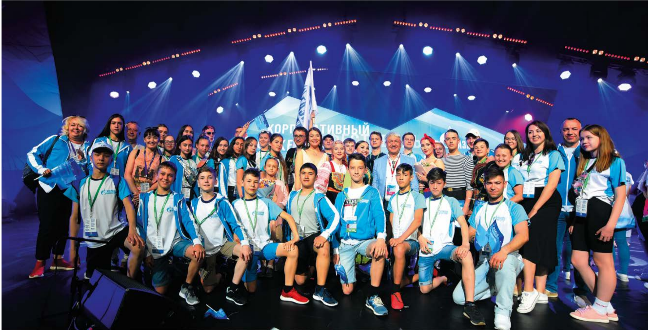
Делегация предприятия увезла из Сочи самые теплые воспоминания

– Сочи, как всегда, встретил нас тепло, с улыбками, все ждали этого мероприятия, мы очень рады вновь оказаться в гостепри-