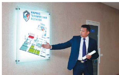
В ТАНДЕМЕ НАУКИ И ПРОИЗВОДСТВА стр. 6