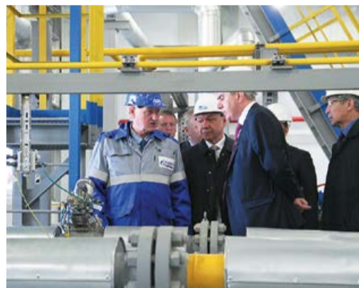
В сборном пункте газа СП-3