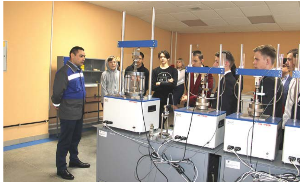
В лаборатории проектно-исследовательских работ проводятся интересные эксперименты

телями и специалистами предприятия могут участвовать в решении актуальных для отрасли задач и приобретать необходимые навыки и компетенции еще в период обучения.