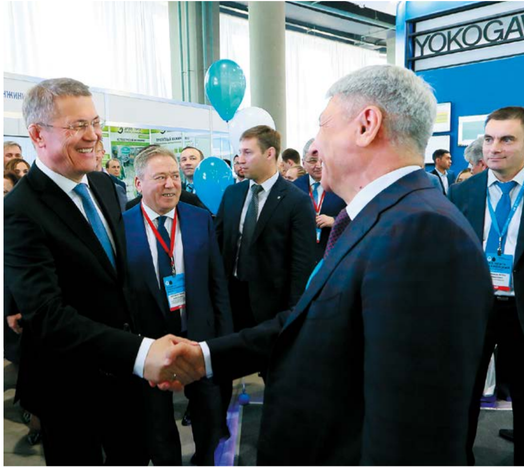
Ради Хабиров ознакомился с экспозицией ООО «Газпром трансгаз Уфа»

Более 350 компаний из 37 регионов России и 10 зарубежных стран, почти 15 тысяч квадратных метров экспозиции и порядка 17 тысяч посетителей. В конце мая Уфа традиционно становится главной мировой площадкой для обсуждения перспектив нефтегазохимической отрасли. Предприятия ассоциации «Газпром» в Башкортостане – в числе постоянных участников выставки «Газ. Нефть. Технологии».