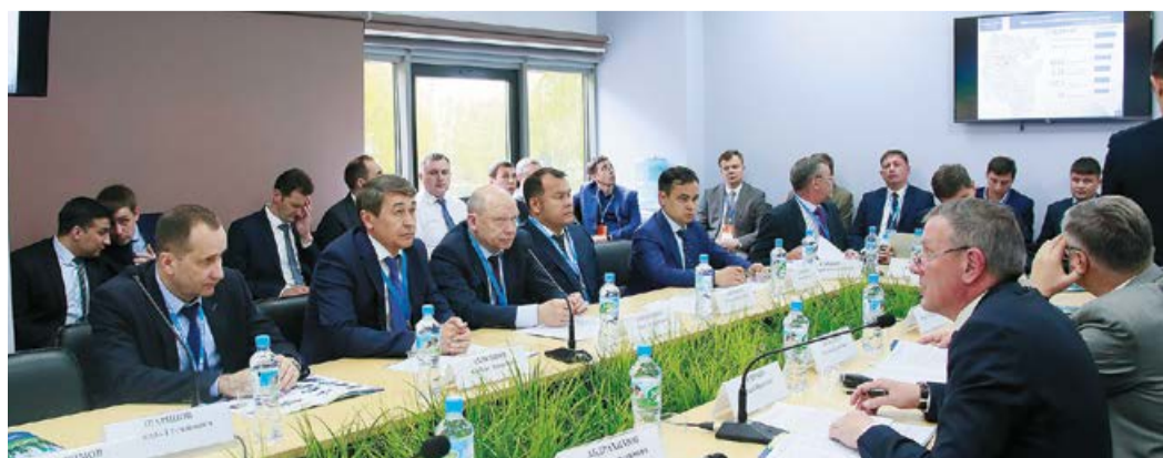
Участники круглого стола обсудили будущее газомоторной инфраструктуры

ялся круглый стол, на котором были рассмотрены актуальные тенденции развития рынка газомоторного топлива. Участники говорили о перспективах строительства объектов газомоторной инфраструктуры в Башкортостане, в том числе о расширении существую-