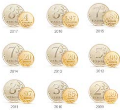
Размер дивидендов, выплаченных на одну акцию

28 июня 2019 года в г. Санкт-Петербурге состоится годовое Общее собрание акционеров ПАО «Газпром». В его рамках планируется утверждение годового отчета компании, распределение прибыли, рассмотрение вопросов о размере дивидендов, сроках и форме их выплаты по итогам работы за 2018 год, а также избрание членов Совета директоров, Ревизионной комиссии и утверждение аудито-