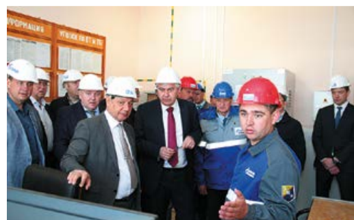
ИНВЕСТИЦИИ В РЕЗЕРВЫ стр. 3

Р.Ф. ХАБИРОВ, временно исполняющий обязанности Главы Республики Башкортостан