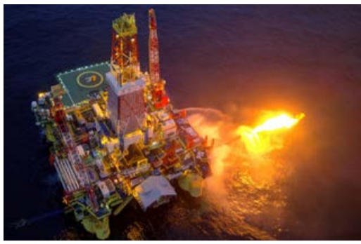
Испытание скважины на Русановском лицензионном участке в Карском море

Экспертные заключения ФБУ «Государственная комиссия по запасам» об открытии компанией «Газпром» новых месторождений углеводородного сырья на шельфе полуострова Ямал утвердило Федеральное агентство по недропользованию. Месторождения им. В.А. Динкова и Нярмейское расположены в пределах Русановского и Нярмейского лицензионных участков в Карском море. По величине запасов газа относятся к категории уникальных и крупных.