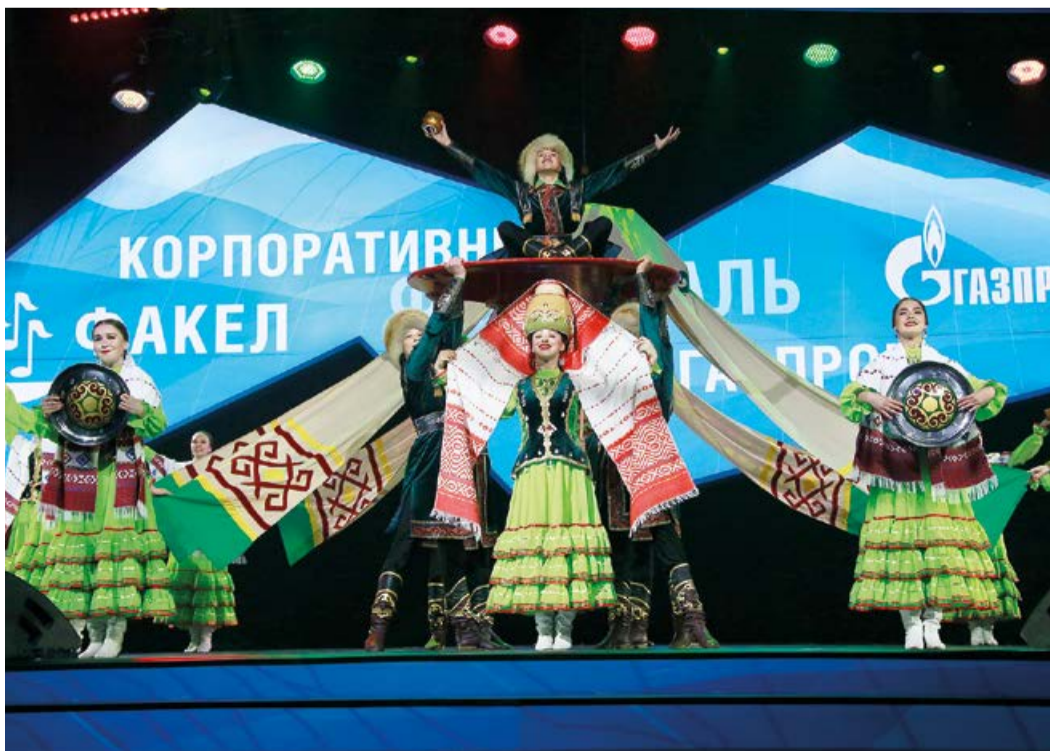
Ансамбль «Далан» воплощает в танцах богатые традиции родного края