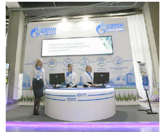
Специалисты ООО «Газпром межрегионгаз Уфа» и ПАО «Газпром газораспределение Уфа» представили единый подход к обслуживанию населения

возможность решить разнообразные вопросы, связанные с эксплуатацией газового оборудования и сетей, заказать техническое, сервисное обслуживание, ремонт уже имеющегося внутрименового газового оборудования, подать заявку на установку и замену счетчиков. Кроме того, желающие могли получить квитанцию на оплату, справку по месту требования, заплатить за газ или сделать перерасчет. Стоит отметить, что единые центры обслуживания принимают заявки на все виды услуг по газификации и работают по всей Башкирии. Здесь клиенту предложат заключить комплексный договор с конкретными