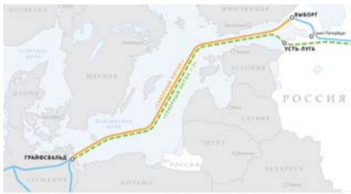
Схема газопроводов «Северный поток» и «Северный поток – 2»

В 2019 году продолжается рост экспорта российского газа в Австрию. Так, если в январе-апреле поставки, по предварительным данным, выросли на 20,5 % по сравнению с аналогичным периодом 2018 года, то 1-20 мая – на 44 %. Вопросы сотрудничества обсудили в ходе рабочей встречи Председатель Правления ПАО «Газпром» Алексей Миллер и Председатель Правления OMV AG Райнер Зеле. Отдельной темой встречи стал ход реализации проекта «Северный поток – 2». В настоящее время в Балтийском море уложено 1290 км газопровода – 52,6 % от его протяженности.