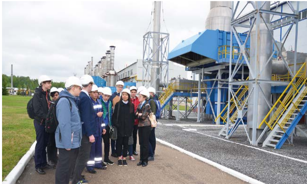
В Дюртюлинском ЛПУМГ учащихся ожидала насыщенная программа

Они имеют возможность углубить свои теоретические знания как в лабораторных условиях, так и в условиях реального производства.