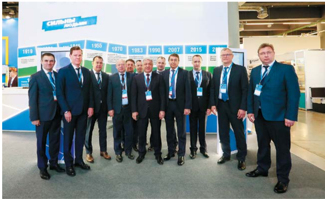
Региональные предприятия Группы Газпром – постоянные участники форума и выставки

В рамках деловой программы форума состо-