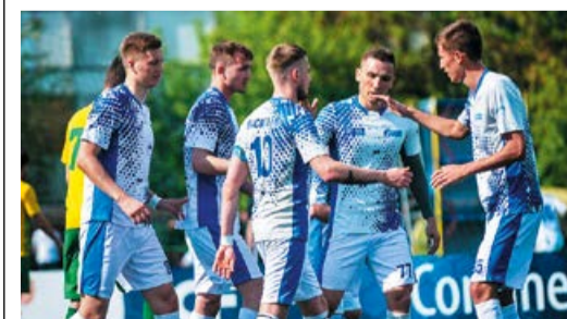
Команда «Витязь-ГТУ» обыграла любительскую сборную Бразилии со счетом 3:2

Футболисты «Газпром трансгаз Уфа» дебютировали в клубном чемпионате мира «8 на 8», который прошел в Москве с участием более 70 команд. Помимо россиян, в нем выступили коллективы из Бельгии, Болгарии, Бразилии, Индии, Италии, Казахстана, Сенегала, Турции, Узбекистана, Украины, Японии. Соперниками уфимских «витязей» на групповом