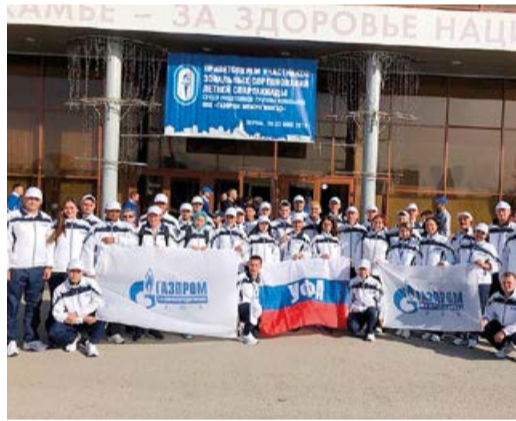
Газовики Башкортостана заняли первое общекомандное место

Представители «Газпром межрегионгаз Уфа» – управляющей организации ПАО «Газпром газораспределение Уфа» успешно выступили в зональных соревнованиях летней Спартакиады ООО «Газпром межрегионгаз». Состязания состоялись в Перми по нескольким видам спорта: настольный теннис, легкая атлетика, плавание, волейбол, футбол, гиревой спорт.