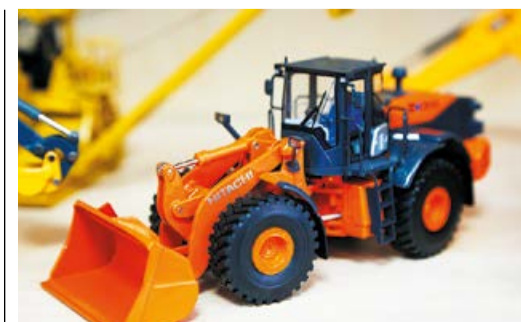
ТЕХНИКА В МИНИАТЮРЕ стр. 7