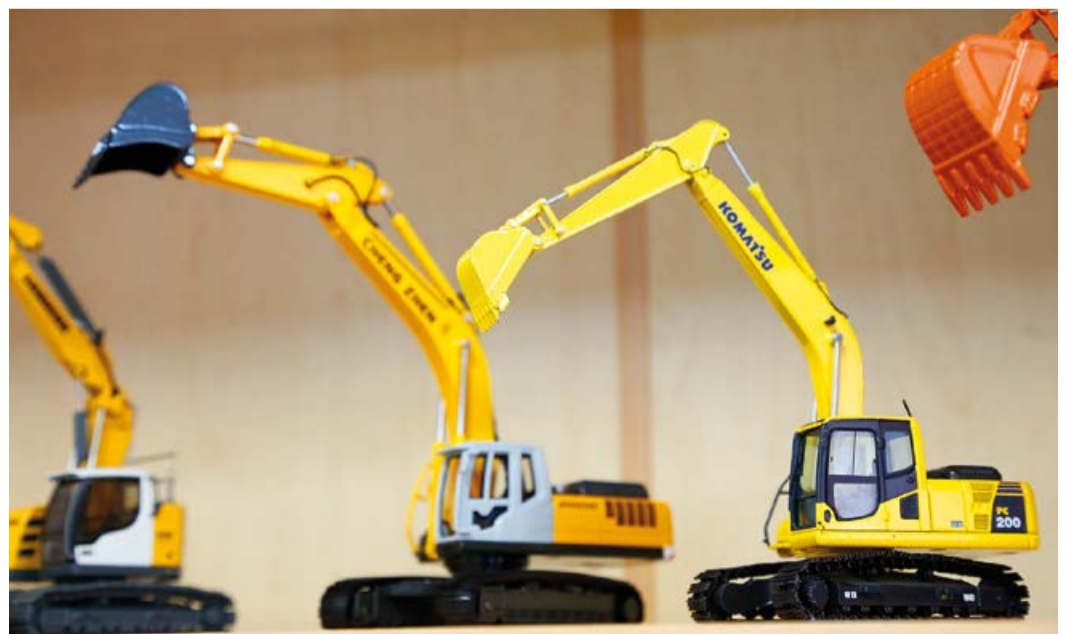
Все модели – копии специальной техники в уменьшенном масштабе