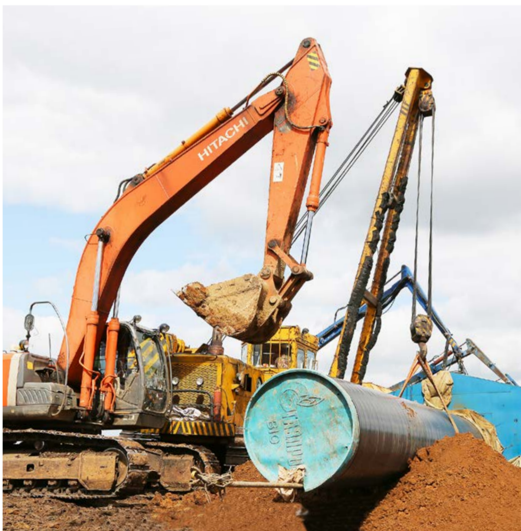
Ремонтные работы на участке газопровода Уренгой–Петровск включают в себя полную замену труб