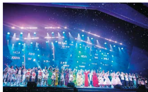
ОЗАРЯЯ ВЕРШИНЫ стр. 4-5