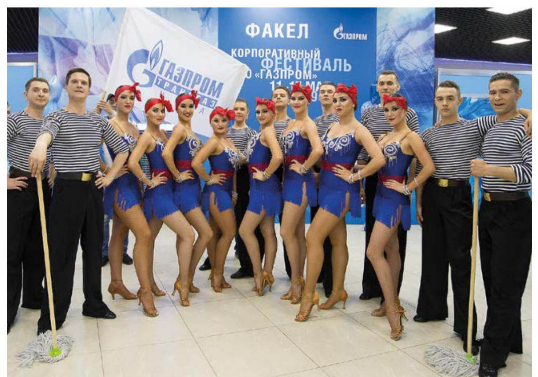
Представители «Триумфа» - традиционно одни из самых ярких участников фестиваля