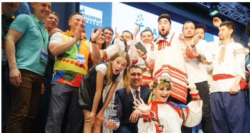
«Мы начинаем КВН!»